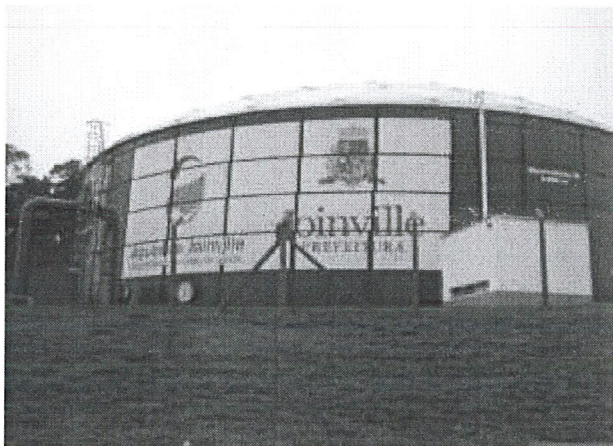
Tanque de 6.000 m 3 – Joinville / SC, para armazenamento de água