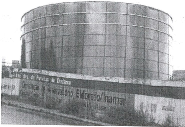
Tanque de 5.000 m3, Diadema / SP, para armazenamento de água

B) Com relação às especificações técnicas insuficientes, sugerimos que os técnicos deste município analisem e estudem as especificações NTS 231 da SABESP, que são efetiva e reconhecidamente as melhores atualmente disponíveis no mercado, estando servindo de parâmetros para muitas outras empresas e companhias de saneamento ante o grau de correção de que se reveste.